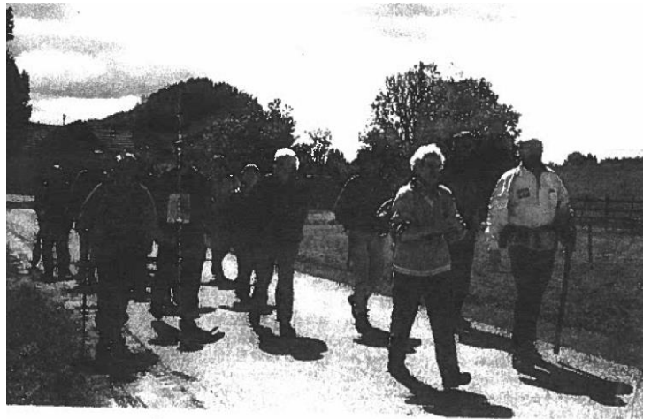
• De groepjes vormen zich tot een grote groep. (foto's Aly Brug)

Een mooi stuk Nederland! Het bosgebied tussen Diepenveen en Olst. In het mooie kerkje te Diepenveen kregen we uitleg over het voormalig Vrouwenklooster. Picknick bij Natuurcentrum "de Zoogenbrink". Slapen en eten in Wijhe. Het was een mooie tocht over de dijk langs de IJssel. De boterbloemen en het fluitenkruid bloeiden welig en onderweg was er tijd voor gesprekstof van allerlei aard. 'Moderne Devotie'?