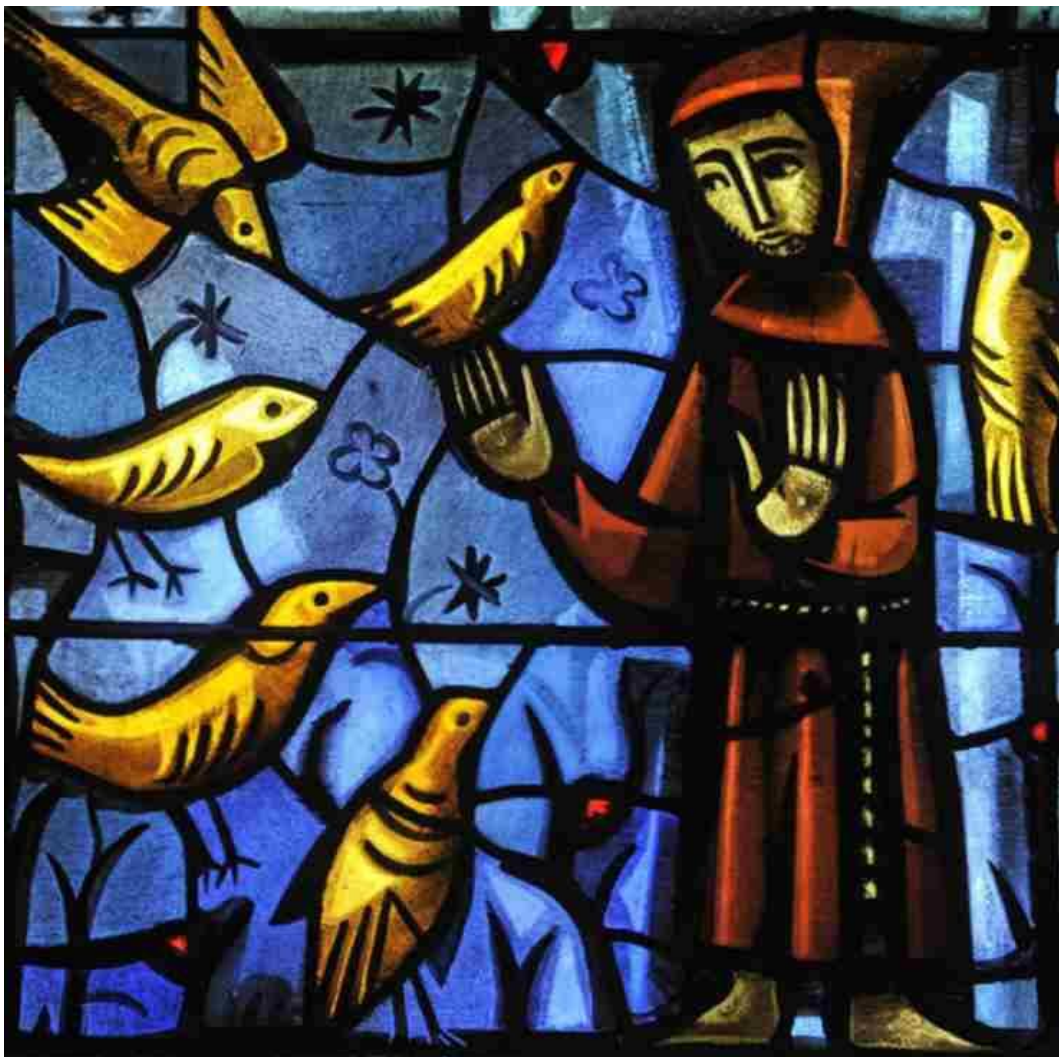
Glas in lood raam van St. Franciscus in Taizé.

MAANDBLAD VAN DE EVANGELISCH- LUTHERSE GEMEENTE ZWOLLE