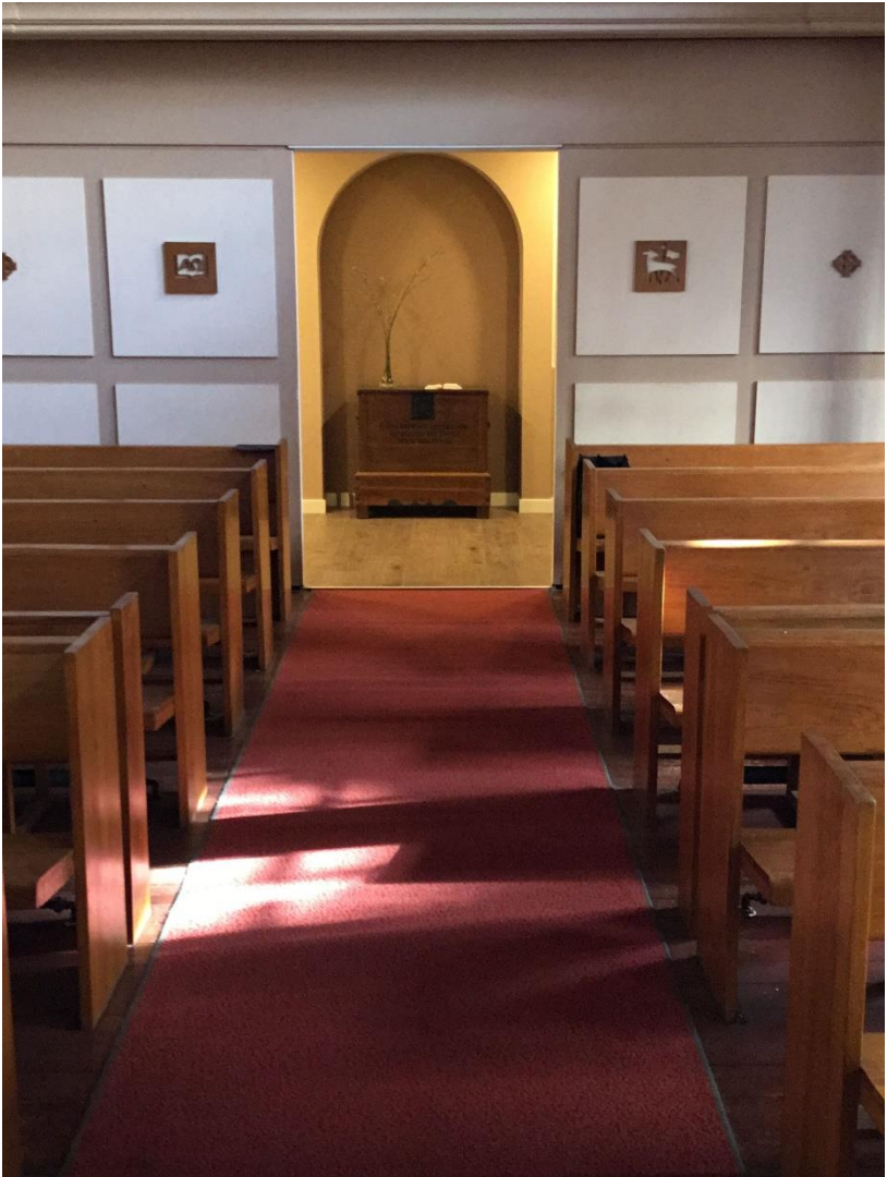
op zondag 29 maart