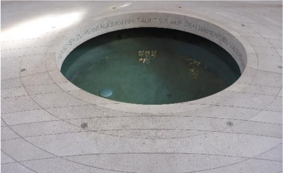
Petri und Paulikirche in Eisleben. Dooptank van Maarten Luther. Foto's gemaakt tijdens de Luthergemeentereis in 2019.