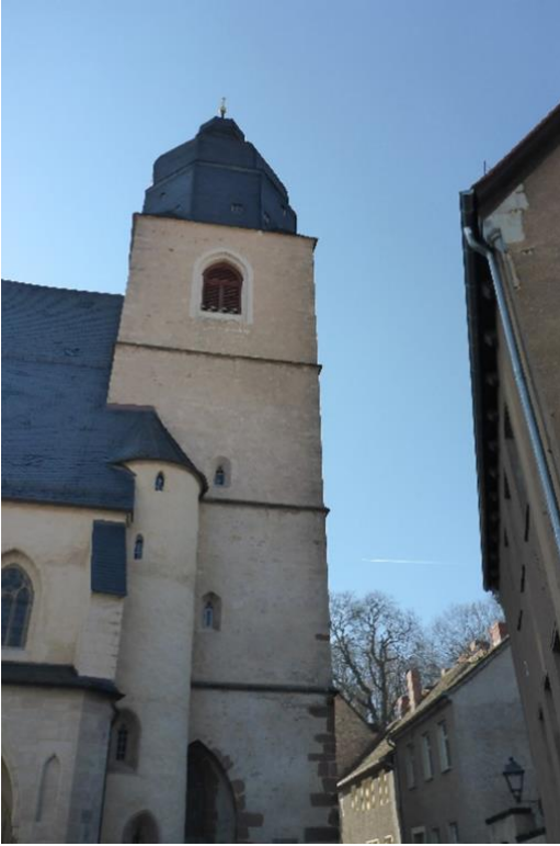
Petri und Paulikirche in Eisleben.