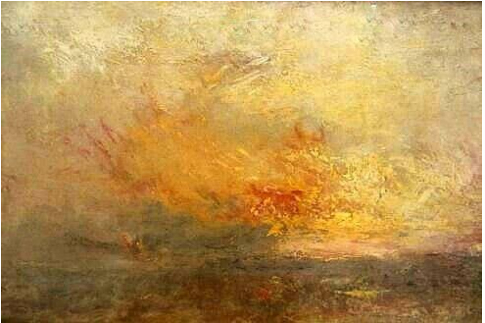
William Turner, Licht

'Laat allen die Jeruzalem liefhebben zich met haar verheugen en juichen om haar.' Jesaja 66,10a