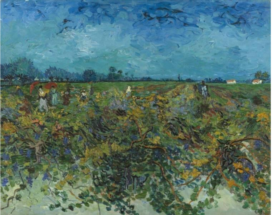
De groene wijngaard, Vincent van Gogh